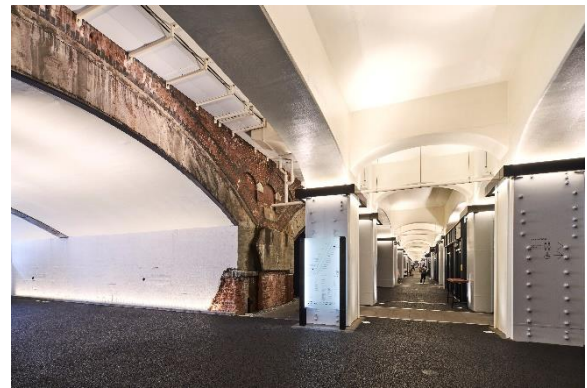
日比谷 OKUROJI 15のひみつ