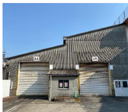
旧・大宮運転区の写真(工事着工前)